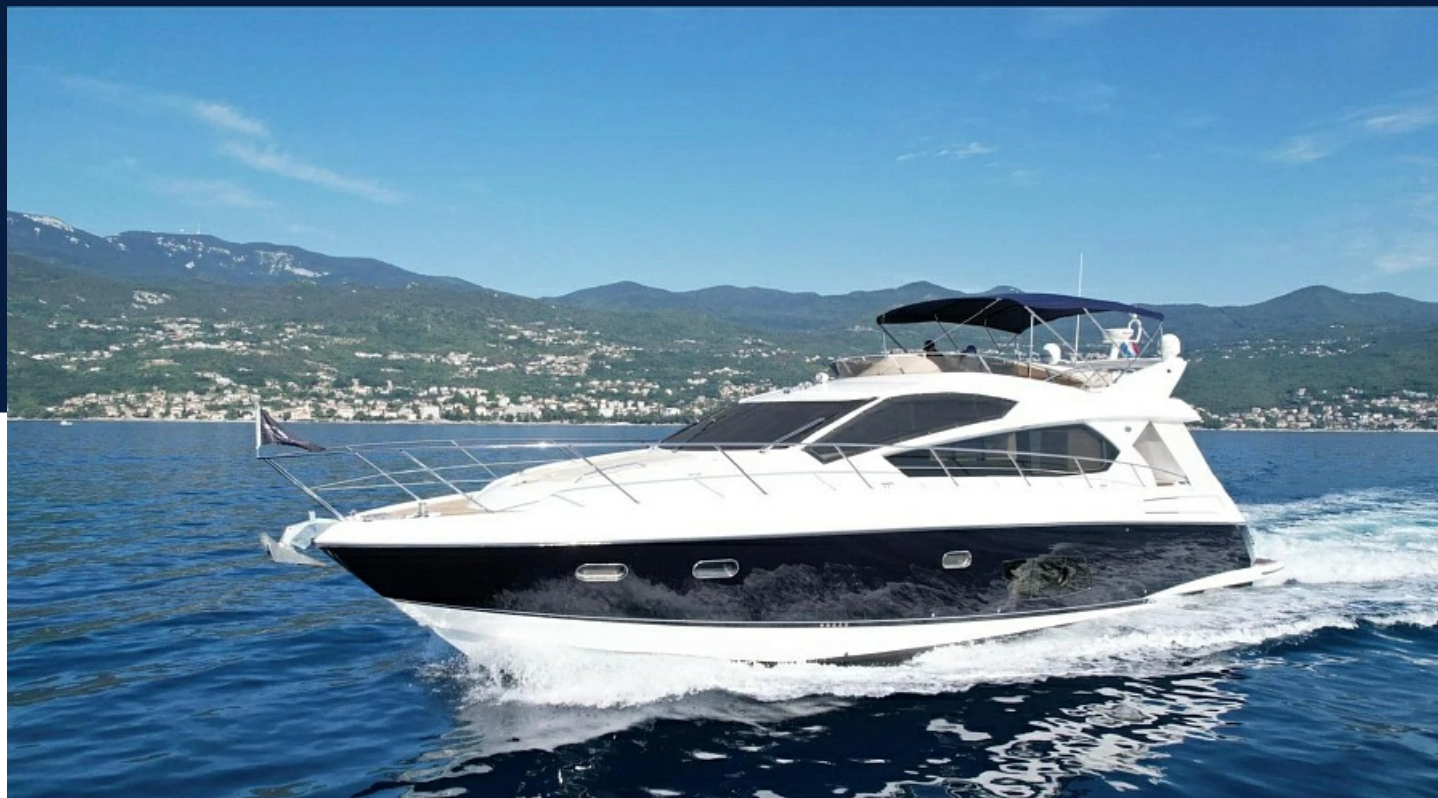
SUNSEEKER MANHATTAN 63