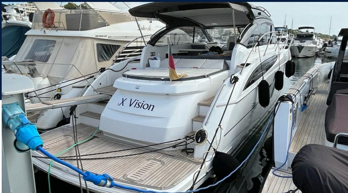
PRINCESS V48 OPEN