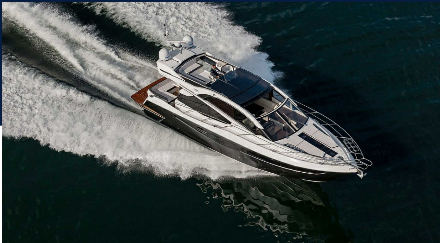
GALEON 560 SKYDECK